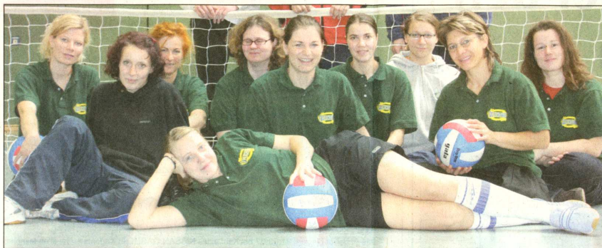
Die Frauen-Nationalmannschaft im Sitzvolleyball ist zur EM nominiert. Woher die Fahrtkosten nach Ungarn kommen sollen, ist allerdings noch ungewiss.

"Ich fiel in ein ziemliches Loch", erinnert sich die sympathische Sportlerin. Nach einigen Jahren ohne sportliche Aktivitäten wurde sie von einer Freundin zum Training im Sitzvolleyball mitgenommen. Als Handballerin hatte sie besten Voraussetzungen und spielte sich schnell wieder in die Stammmannschaft. Heute ist die Aschersleberin ein wichtiger Teil im Projekt "Paralympics 2008".